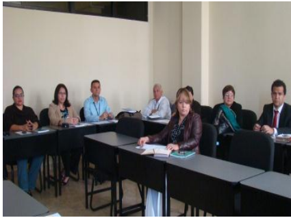
Reunión con VRIP, DPL y Enlaces de Investigación 28.11.11

investigación, (6) participar del proceso de sistematización de buenas prácticas relacionadas con la gestión de la investigación en UPNFM.