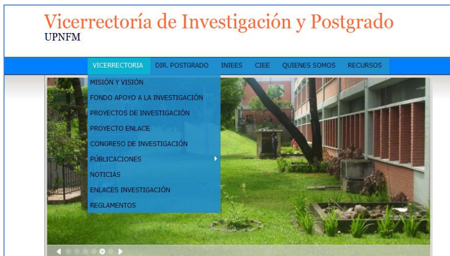
Áreas de trabajo más relevantes del trabajo de la VRIP.

Asimismo, se está promoviendo diferentes herramientas tecnológicas siendo estas: aula virtual, blog, wiki y foro.