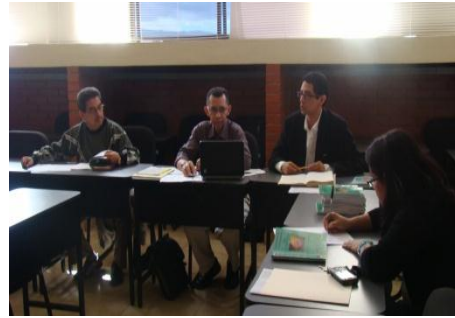
Reunión con VRIP, DPL y Enlaces de Investigación 01.11.11