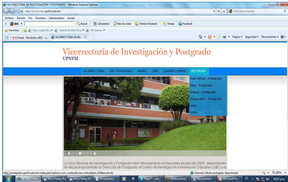
Sistemas de comunicación en la página web de la VRIP